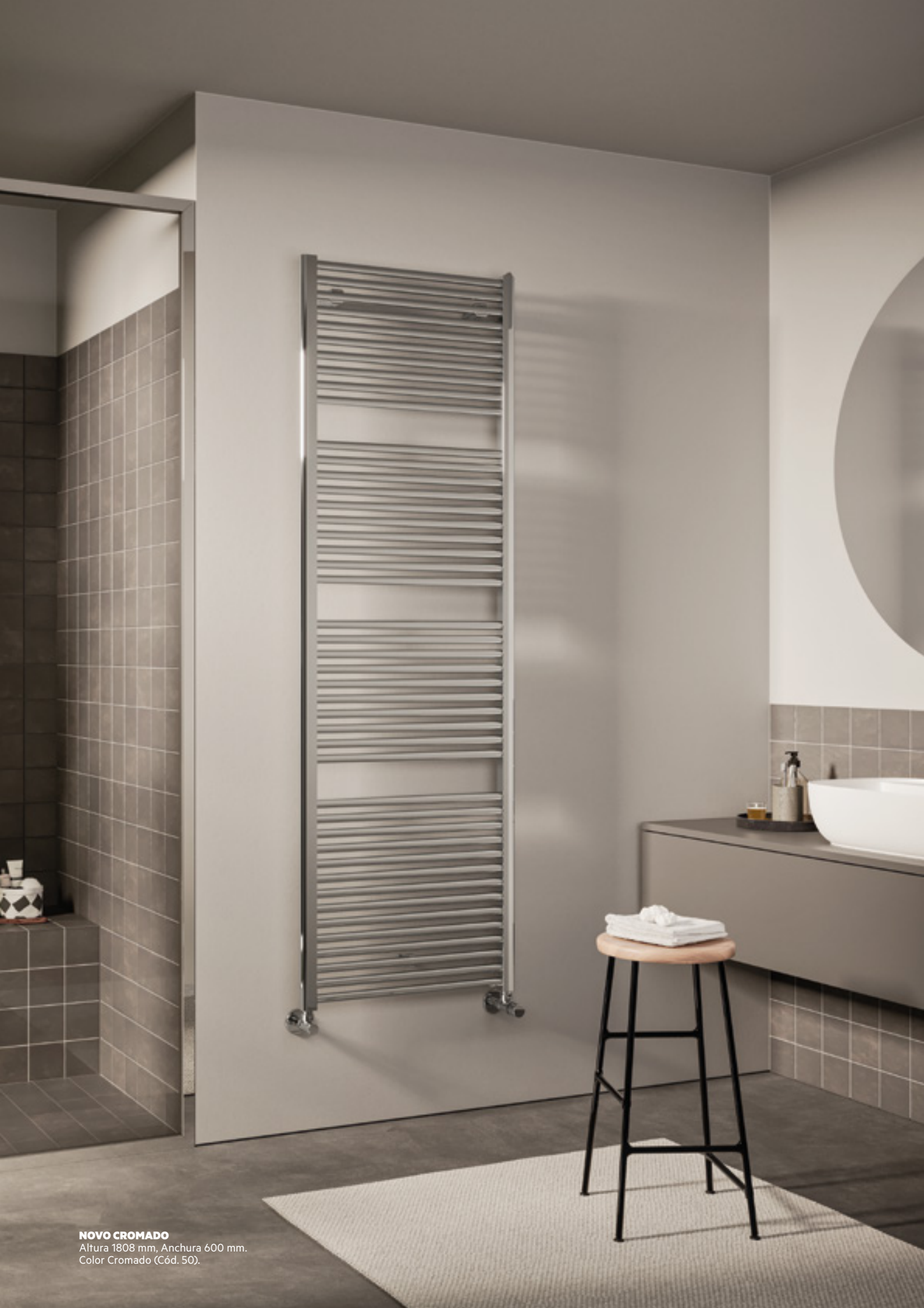
NOVO CROMADO Altura 1808 mm, Anchura 600 mm. Color Cromado (Cód. 50).