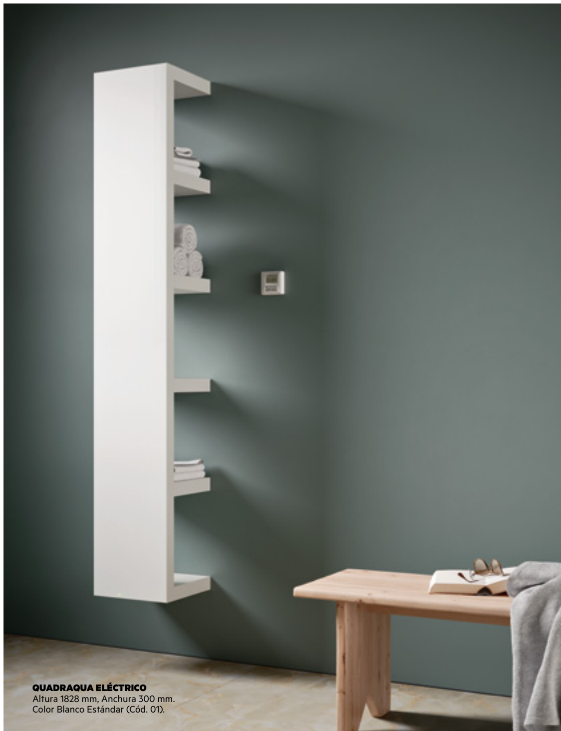
QUADRAQUA ELÉCTRICO Altura 1828 mm, Anchura 300 mm. Color Blanco Estándar (Cód. 01).