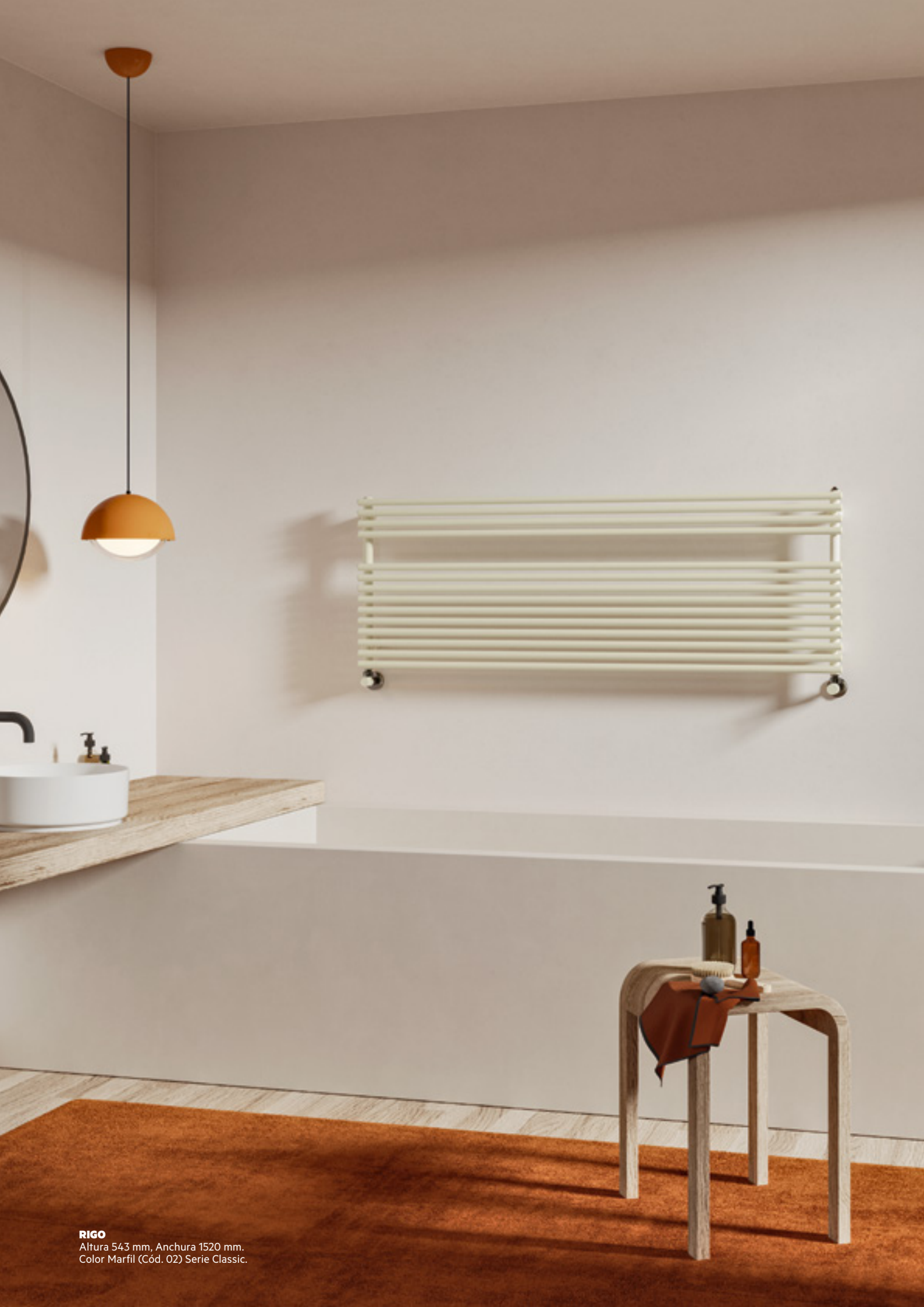
RIGO Altura 543 mm, Anchura 1520 mm. Color Marfil (Cód. 02) Serie Classic.