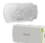
21KITSTART1 Kit conexión NOW

Para el funcionamiento del Sistema NOW es necesario comprar a parte un Kit de Conexión NOW para cada instalación individual. Incluye una Unidad de Conexión que se debe conectar mediante cable RJ-45 al router y un Termostato de Control NOW Cód. 21KITSTART1. No incluidos en la configuración TESI NOW.