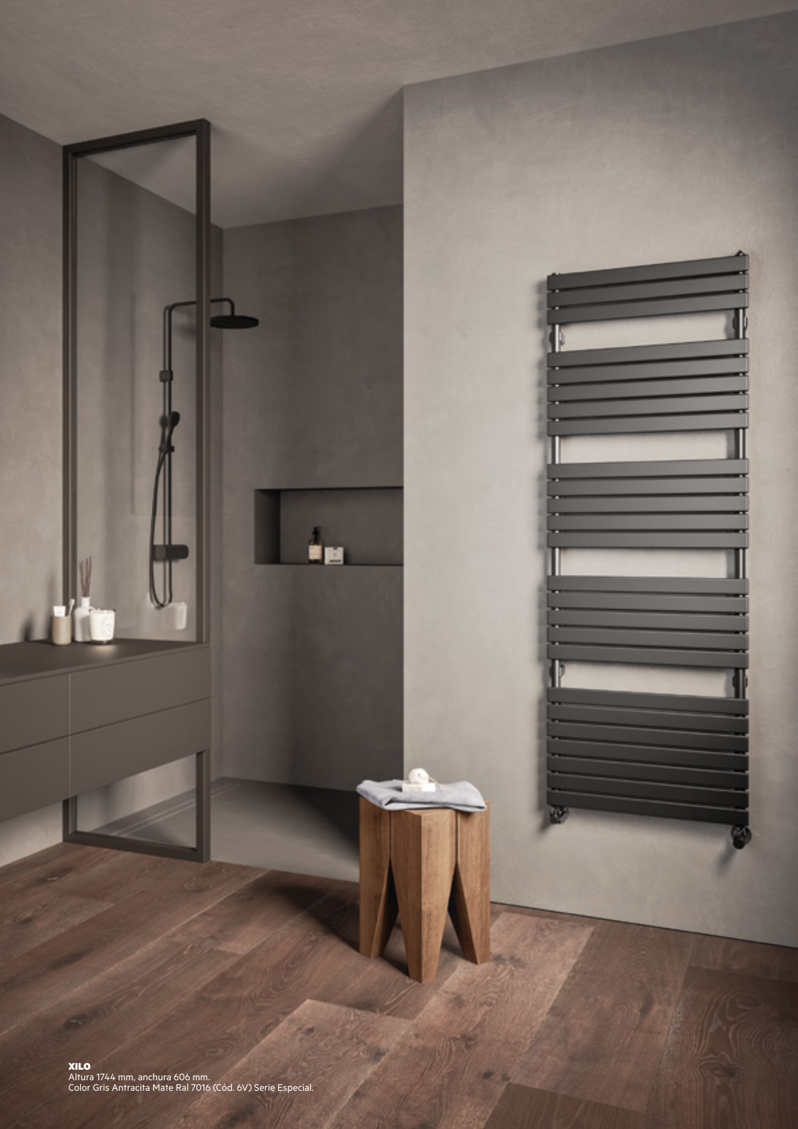
XILO Altura 1744 mm, anchura 606 mm. Color Gris Antracita Mate Ral 7016 (Cód. 6V) Serie Especial.