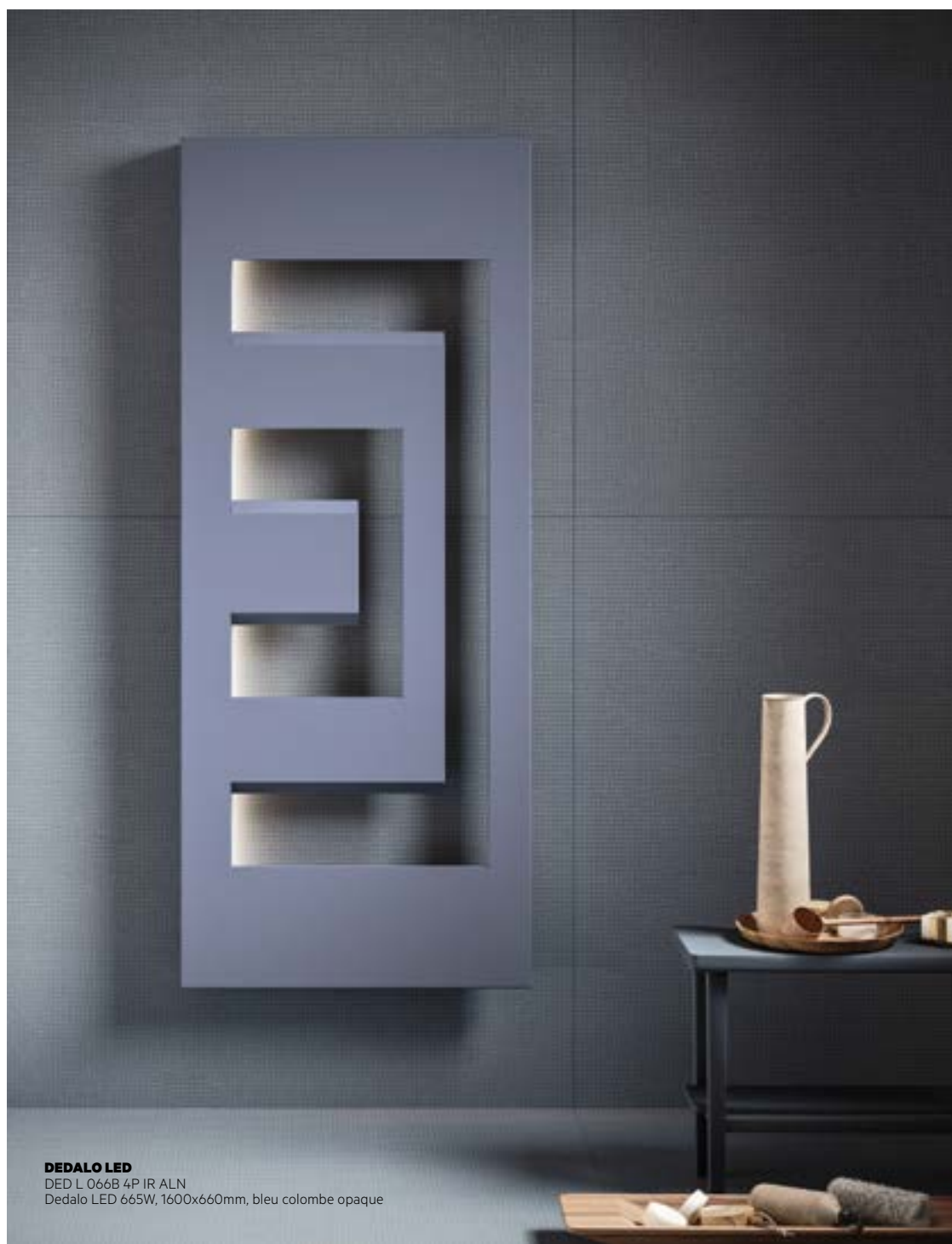
DEDALO LED DED L 066B 4P IR ALN Dedalo LED 665W, 1600x660mm, bleu colombe opaque