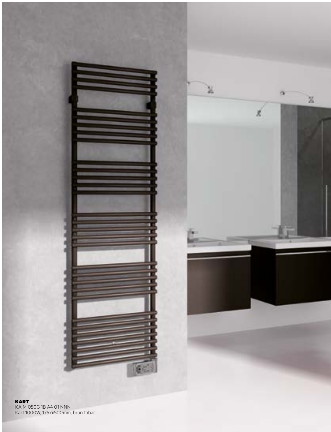
KART KA.M.050G.1B.A4.01.NNN Kart 1000W, 1757x500mm, brun tabac