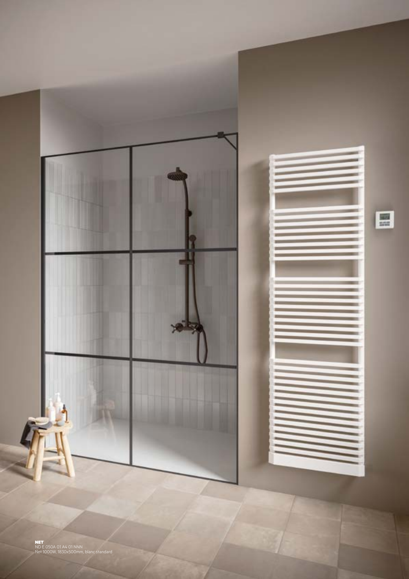
NET ND E 050A 01 A4 01 NNN Net 1000W, 1830x500mm, blanc standard